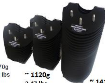
~ 870g 1.92 lbs